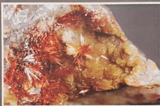
Carminite, gisement d'Echassières